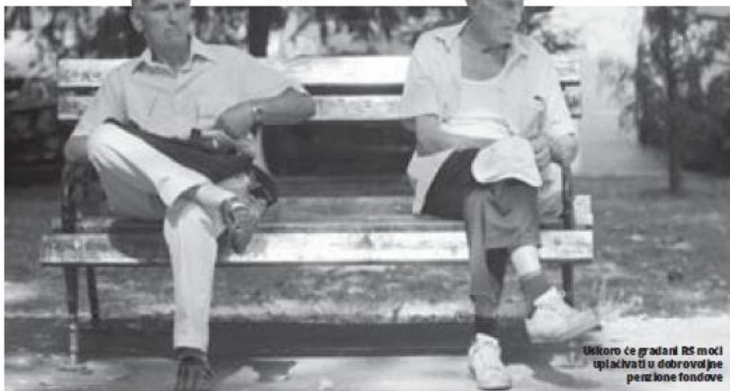
Uskoro će građani RS moći uplaćivati u dobrovoljne penzione fondove

Opres: Iako su prošle dvije i po godine od usvajanja Zakona o dobrovoljnim penzijskim fondovima, ozbiljnijeg pokušaja investitora da krenu u tom pravcu do sada nije bilo